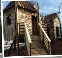
Les cabanes perchées