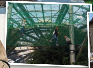
Le parcours suspendu au dessus des crocos !